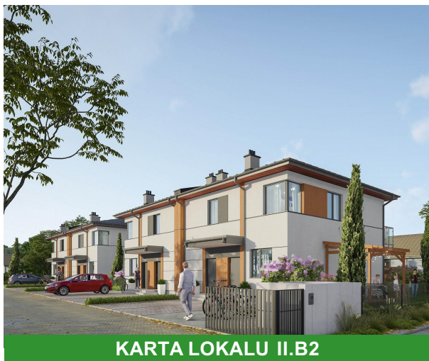
KARTA LOKALU II.B2