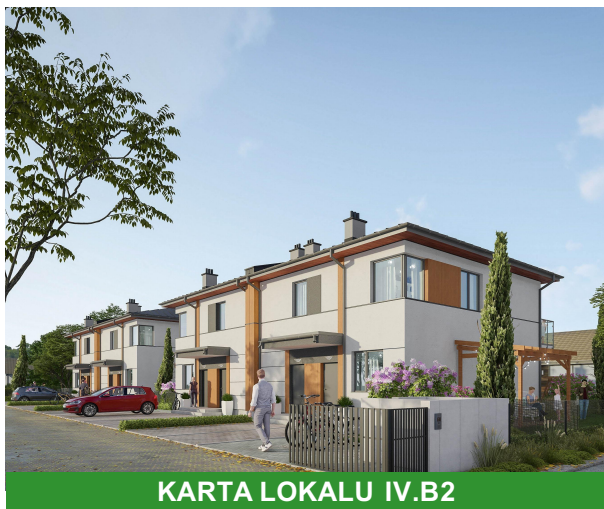
KARTA LOKALU IV.B.2