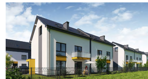
Widok osiedla od strony ogrodu